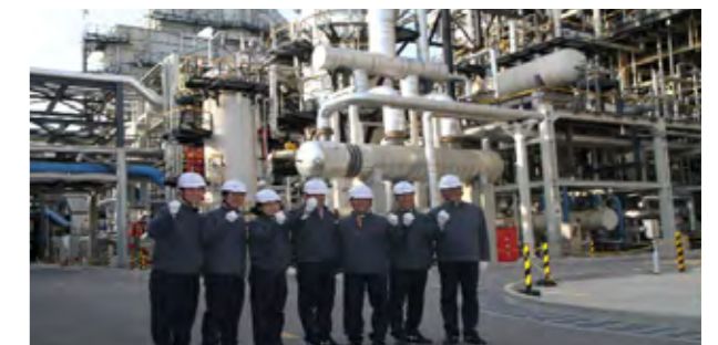
이사회 생산 현장 방문(2017년 4월)

또한 SK이노베이션 이사회는 감사실적 보고를 통해 리스크가 발생할 수 있는 사항을 점검하고 있으며, 이슈 및 리스크 관리 전문성 향상을 위해 매년 전략 Session을 실시하고 있습니다. Session에서는 전사와 주요 사업의 전략, 추진 동향 및 주요 리스크에 대한 보고가 이루어지며, 리스크 관리 방안 등 의사결정 전반을 지원하기 위한 자료를 함께 제공하고 있습니다. 또한 대내외 경영환경을 고려하여 주요 이슈들과 연관된 법률, 커뮤니케이션 등 관련 분야의 전문가를 초빙해 세미나를 개최하고 있습니다.