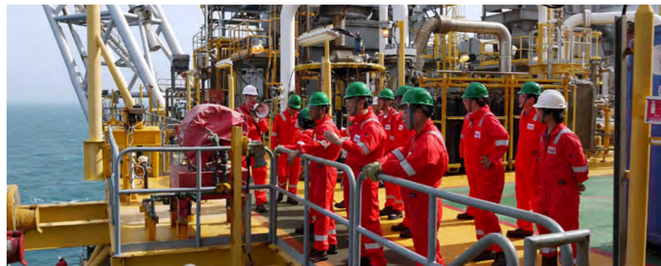
베트남 호치민에서의 현장 이사회 개최(2017년 11월)

2017년에는 SK인천석유화학과 베트남 호치민에서 현장 이사회를 개최하여 주요 사업 현안에 대한 이해도를 높이는 한편, 구성원들과 함께 하는 자원봉사 활동과 SK이노베이션 계열 전 임원·팀장 대상의 사외 이사 특강 등을 통해 임직원과의 커뮤니케이션을 강화하였습니다.