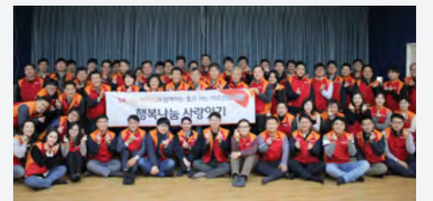
이사회 자원봉사 활동(2017년 11월)