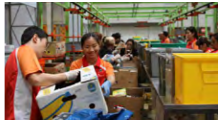
휴스턴 푸드뱅크 자원봉사 활동

SK이노베이션 E&P 북미사업본부는 활발한 사회공헌 활동을 펼치며 지역 융화 및 기여를 위해 적극 노력하고 있습니다. 먼저 저소득층 결식아동 및 노숙인의 불안정한 음식 섭취와 영양 결핍 문제를 해결하기 위해 비상 식량을 제공하는 '휴스턴 푸드뱅크' 자원봉사를 진행 하였습니다. 이틀간 전 임직원이 함께 참여하여 푸드뱅크 음식을 직접 포장·배달하였으며, 이를 통해 결식아동과 노숙인의 식품 공급 및 영양상태 개선에 기여하였습니다. 또한 탈사 지역 교사와 학생들의 과학·기술·공학·수학 역량을 높이기 위한 사회공헌 교육 프로그램인 TRSA 교육 프로그램과 Rice 대학교 한국학 장학생에게 각각 5만 달러를 기부하여, 지역사회에 양질의 교육 기회를 제공하였습니다.