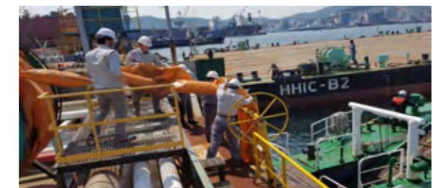
물류센터 해양 방제훈련