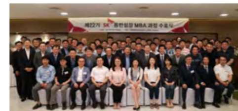
동반성장 MBA 과정 수료식