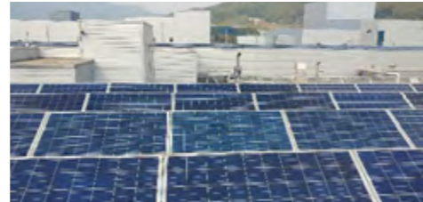
중평 태양광 발전소

SK이노베이션은 23.1억 원을 투자하여 0.936MWh 규모의 태양광 발전설비를 설치하고, 연료 전지를 활용하여 사업장 내 전력 부하를 관리하는 등 신재생에너지에 대한 투자 및 도입을 확대해나가고 있습니다.