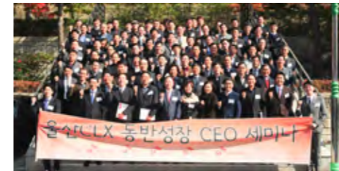
동반성장 CEO 세미나

또한 울산 지역 청년을 대상으로 ‘협력회사 채용박람회’를 지속적으로 개최하여 중소기업의 우수인재 확보, 청년실업 해소 및 지역경제 활성화에 기여하고 있습니다. 맞춤형 상담과 더불어 직업심리 검사, 이력서 사진 촬영 등 구직자를 위한 다양한 지원활동을 제공하고 있으며, 2017년에는 총 112명의 구직자들이 채용박람회를 통해 중소기업에 채용되는 성과를 거두었습니다. 이 외에도 직무교육과 인턴십 기회를 제공하는 ‘SK고용디딤돌’ 프로그램을 통해 청년 구직자의 취업 경쟁력 강화를 돕고 있습니다.