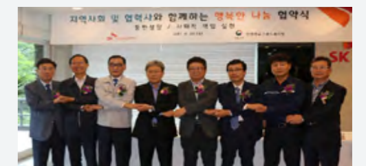
행복한 나눔 협약식

2017년 5월 첫 시행 시에는 전체의 95%에 해당하는 구성원들이 자발적으로 참여하여, 총 2억 원 규모의 기금을 16개 사 협력회사 직원에게 전달하였습니다.