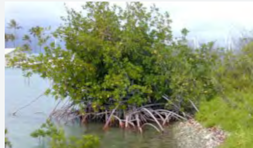
베트남 맹그로브 숲

이에 SK이노베이션은 글로벌 차원의 기후변화 대응 및 생물다양성 보존 추진을 위하여 해수면 상승 등 기후변화에 가장 취약한 베트남에서 맹그로브 숲 복원 사업을 시작하였습니다. 2018년 중 베트남 짜빈성 지역 5ha의 맹그로브 숲을 조성하는 것을 목표로 사업을 전개하고 있으며, 베트남 정부도 적극적인 호응을 보이며 함께 동참할 예정입니다.