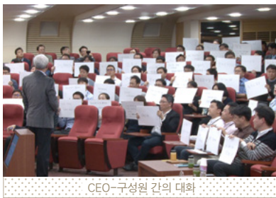
CEO-구성원 간의 대화