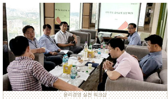
윤리경영 실천 워크샵

SK이노베이션은 2016년 리더 주도의 윤리경영 실천 워크샵을 통해 윤리적 딜레마와 리스크 사례에 대한 토의를 진행하고 있습니다. 1차, 2차 워크샵별로 각각 임원, 팀장이 리더로 참석하여 구성원 간 활발한 논의를 전개하였으며, 2017년에도 지속적으로 실시할 예정입니다.