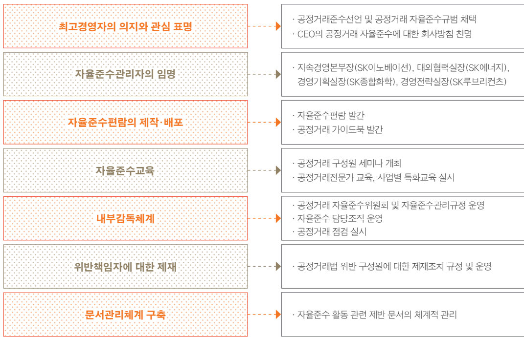
공정거래 자율준수 프로그램 7대 요소

SK이노베이션은 거래 투명도 제고 및 공급망 내 공정 경쟁 활성화를 위하여 공정거래 자율준수 프로그램(CP: Compliance Program) 도입을 통한 관리 체계를 구축하였습니다. CP 7대 요소를 정의하여 세부 관리 지침을 수립하였으며, 이를 통해 SK이노베이션 전 자회사 구성원 및 사업활동에 대하여 각 요소별 체계적인 관리를 실시하고 있습니다.