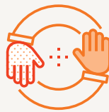
제품판매 및 거래 관계 (공정거래)