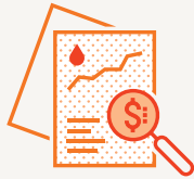
불안정한 석유가격 및 재무 리스크