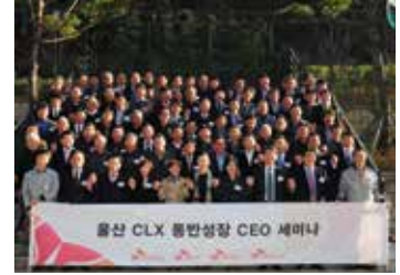
2015 울산Complex 동반성장 CEO 세미나

협력회사와의 지속적인 소통을 통해 협력회사의 애로사항을 해결하고 더 발전된 협력 방안을 모색하려 노력하고 있습니다. 주기적으로 협력회사 CEO를 대상으로 경영혁신 사례 등을 공유하는 동반성장 CEO세미나를 운영하고 있으며, 연 1회 실시하는 협력회사 CEO 간담회를 통해 품질 향상과 SHE 관리 방안에 대해 논의합니다. 이 밖에도 설비 협력회사를 대상으로 매월 안전보건 점검 및 교육, 사고 사례 공유를 하는 협의회를 운영하고, 상시적으로 장치검사기계물류 협력회사가 참여하는 간담회를 개최하여 SHE 관리 역량 및 업무 확대 방안에 대해 논의합니다.