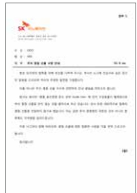
명절선물 안 주고 안 받기 캠페인

SK이노베이션은 협력회사와의 상호 신뢰를 바탕으로 한 윤리경영을 실천하고 있습니다. 구매 포탈을 통하여 협력회사를 등록할 때에는 '공정·투명거래 동의서'에 서약하는 과정을 거쳐야 하며, 협력회사의 부정, 부패 행위가 적발될 경우에는 관련 사규에 따라 엄중한 조치를 취하고 있습니다. 이외에도 2011년부터 협력회사 및 대리점, 거래처 등 외부 이해관계자들을 대상으로 '명절선물 안 주고 안 받기' 캠페인을 실시하여 공정하고 투명한 거래문화를 정착해나가고 있습니다. 반송이 어려운 선물을 수령했을 경우 수령한 구성원은 사업장별 담당부서에 선물 내역을 제출해야 합니다. SK이노베이션 차원에서 반송이 어려운 선물을 수거하여 사내 사회 공헌 담당부서에서 연말 행복바자회에 출품하여 구호기관에 전달하거나, 식료품 등 유통기한이 짧은 선물은 인근 아동복지기관이나 지역아동센터에 전달합니다.