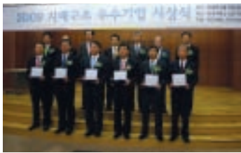
기업지배구조 최우수상 수상