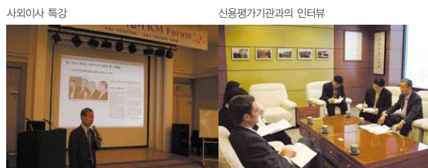
사외이사 특강 신용평가기관의 인터뷰

| 사외이사 특강 | 사외이사들의 전문분야에 대한 해박한 지식과 경험을 바탕으로 임직원을 대상으로 특강을 실시하여 임직원의 지식 함양에 기여하고, 이사회 경험을 임직원들에게 직접 알림으로써 이사회 활동에 대한 임직원들의 이해도를 제고시킴과 동시에 구성원의 의견