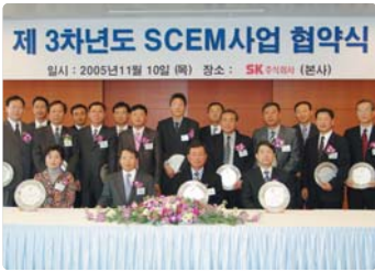
III 사진 42_SCEM사업 협약체결식