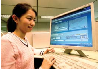
III 사진 41_구매대금 결제 시스템