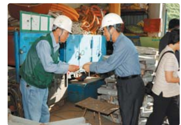
III 사진 40_ CEO 협력회사 방문