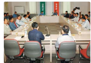
III 사진 39_ 협력회사 간담회

SK(주)가 발주한 물품 등의 제조 및 가공 등에 필요한 운전자금 지원을 위하여 2004년 12월 기업은행과 '실적방식 Network Loan' 계약을 체결하여 중소협력회사를 지원 중에 있습니다. 또한 협력회사와의 Partnership 강화를 위하여 제품 대금 조기결제, 금융비 보전, 우수대리점 및 협력회사에 대한 Incentive 지급, Marketing Agent에 대한 자금 조기지급 등을 실시하고 있으며, 환경보전을 위한 VOC 차량개조 자금지원 등을 실시하고 있습니다.