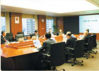
III 사진 2_제1차 이사회