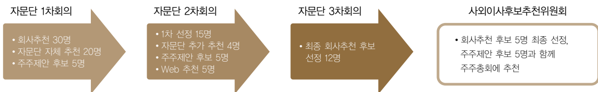
III 그림 6_ 2004년 정기총회 사외이사 후보추천 절차