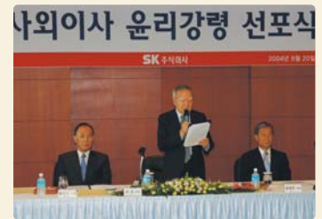
III 사진 1_ 사외이사 윤리강령 선포식