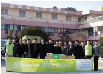
III 사진 48_사회복지시설(모자원) 난방유 지원