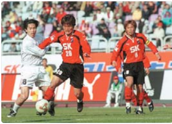
III 사진 65_ 부천 SK프로축구단