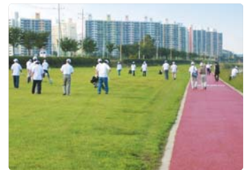
III 사진 52_유성구 갑천 자연정화 활동