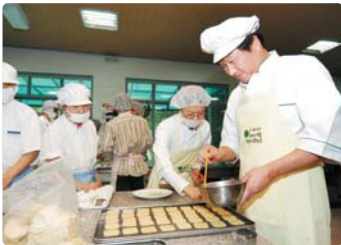
III 사진 47_WeCan 마을 쿠키생산 돕기