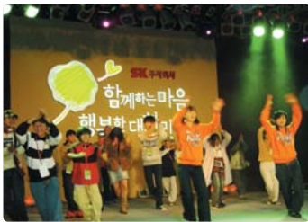
III 사진 56_연말연시 불우이웃 초청행사