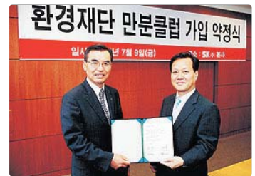
III 사진 60_ '만분클럽' 가입 약정식