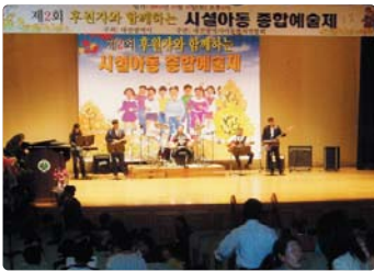
III 사진 67_ '문화나눔' 프로그램 참여