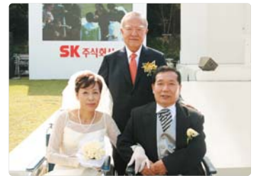
III 사진 51_장애우 결혼식 지원