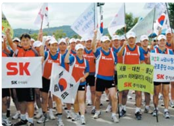
III 사진 57_마라톤을 통한 불우이웃돕기