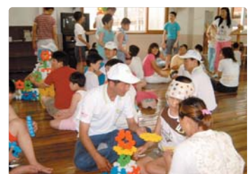
III 사진 54_재활원 장애우 봉사