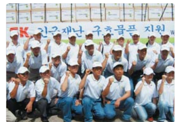
III 사진 53_제주 수해현장 복구지원