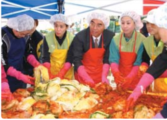
III 사진 45_Sweet Kimchi 나누기 캠페인