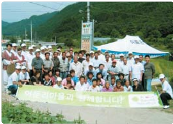
III 사진 46_농촌사랑 1촌 1촌운동(어둠의마을)