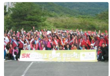
III 사진 62_ 자연보호 한마음 등반대회