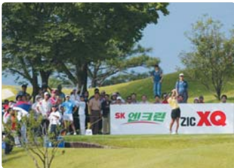
III 사진 66_ SK 엔크린 인비테이셔널 여자 골프대회