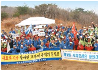
III 사진 49_지체장애우 동반대회

I Sweet Kimchi 나누기 캠페인 I 2004년 11월 22일부터 12월 17일까지 서울, 대전, 대구, 광주, 부산, 제주 등 전국 37개 지역에서 SK(주)천사단, YMCA회원 및 자원봉사자 1만여 명이 함께 김치 9만 4천 포기를 만들어 무의탁 독거노인, 소년소녀 가장, 한부모 가정 등에 전달하는 'Sweet Kimchi 나누기 캠페인'을 벌였습니다. 이 행사를 통하여 대도시뿐 아니라 그동안 지원에서 소외되었던 중소 도시 및 농어촌 지역의 어려운 이웃에게도 김치를 제공하였습니다.