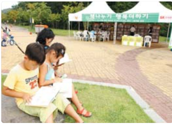
III 사진 64_ 사랑의 책 나누기 운동