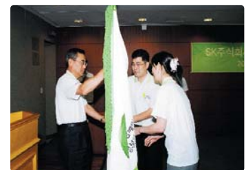
III 사진 43_SK(주) 자원봉사단 출범식