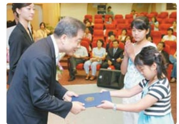
III 사진 61_ 환경사랑 어린이 글모음 잔치 시상식