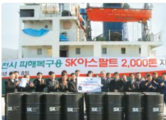
III 사진 58_용천 피해복구 지원