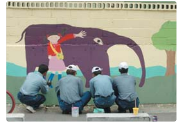
III 사진 50_울산지역 벽화그리기