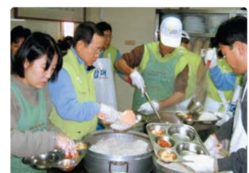
III 사진 44_다일 복지재단 '밥퍼' 활동