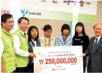
III 사진 55_엔크린 소년소녀 가장돕기