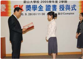
III 사진 63_ 산학협동 장학금 지원