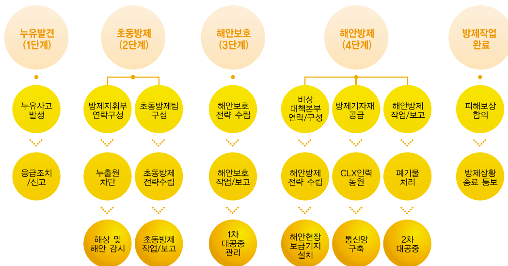
Fig 7. 해상누유사고 사나리오별 방제절차