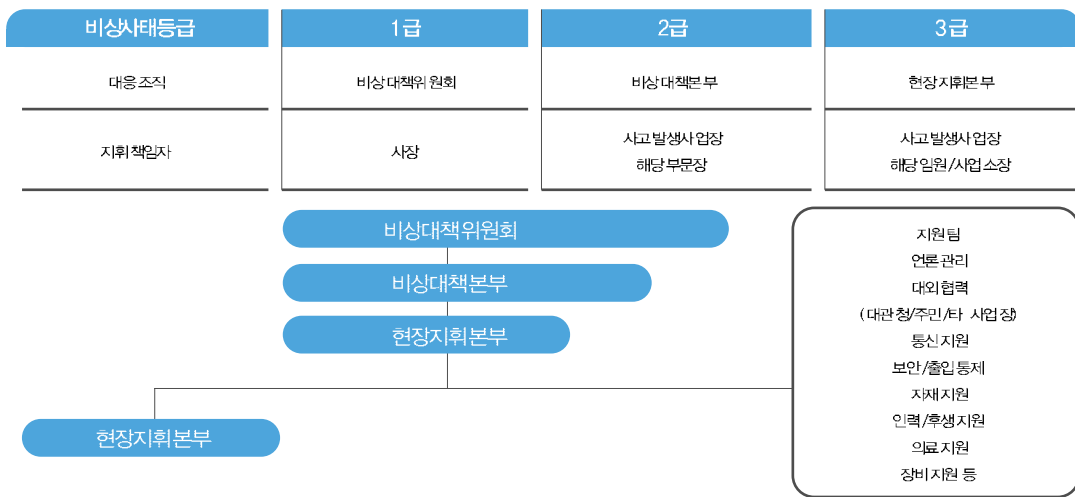
Fig 6. 비상사태 대응체계 및 조직도

SK는 예기치 못한 안전환경사고 또는 천재지변으로 인하여 회사의 경영활동에 심각한 영향을 미치거나 미칠 우려가 있는 상황에 대비하여 사고 규모에 따라 비상사태 대응절차를 수립, 사고에 대한 재난범위 및 환경에 미치는 영향을 최소화하도록 하고 있습니다. 또한 동시 통보시스템을 구축하여 사고발생 시 신속히 대처할 수 있도록 하였으며, 주기적인 소집훈련과 함께 실제상황을 재현한 해상방제 훈련을 통하여 사고에 따른 피해를 최소화하고 있습니다.