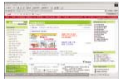
Fig 5. 전사 KMS내 안전환경보건 Topic

SK의 모든 SHE 정보는 전사 KMS (Knowledge Management System) 내 안전환경보건 Topic 내에 관리되고 있습니다. 이는 사내의 모든 암묵적 SHE 지식들을 회사 내 관련 임직원이 쉽게 접근할 수 있는 환경을 조성하여 주면서 전사 지식수준 향상은 물론 정보공유를 통한 SHE 업무효율 증대 효과를 이룩할 수 있도록 하기 위함입니다. 더불어 임직원의 SHE 마인드 확산을 위한 효과적인 Communication Tool로서도 사용되고 있습니다.