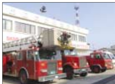
Fig 29. 울산 CLX 소방차