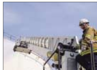
Fig 30. 소방살수 훈련