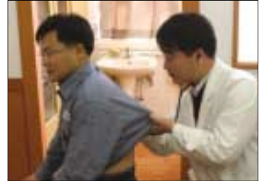
Fig 31. 울산 CLX 의료검진

2002년 말 당사는 그 동안 개별로 이루어졌던 보건관리를 SHE 경영시스템에 통합하여 운영하게 되었습니다. 이는 회사가치 창출에 미치는 임직원의 보건문제가 경영의 중요한 문제로 인식되어 확대 개편되었기 때문이며, 이에 따라 SK의 보건경영은 방침에서 감사에 이르기까지 선진적인 경영시스템을 갖추게 되었습니다. SK는 또한 사업장별로 자체 보건규정 절차를 갖추도록 하고 있으며, 이는 다음과 같은 사항을 포함하고 있습니다.