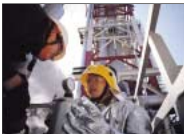
Fig 28. 화재진압 훈련