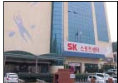
Fig 32. 울산 CLX 스포츠센터 전경